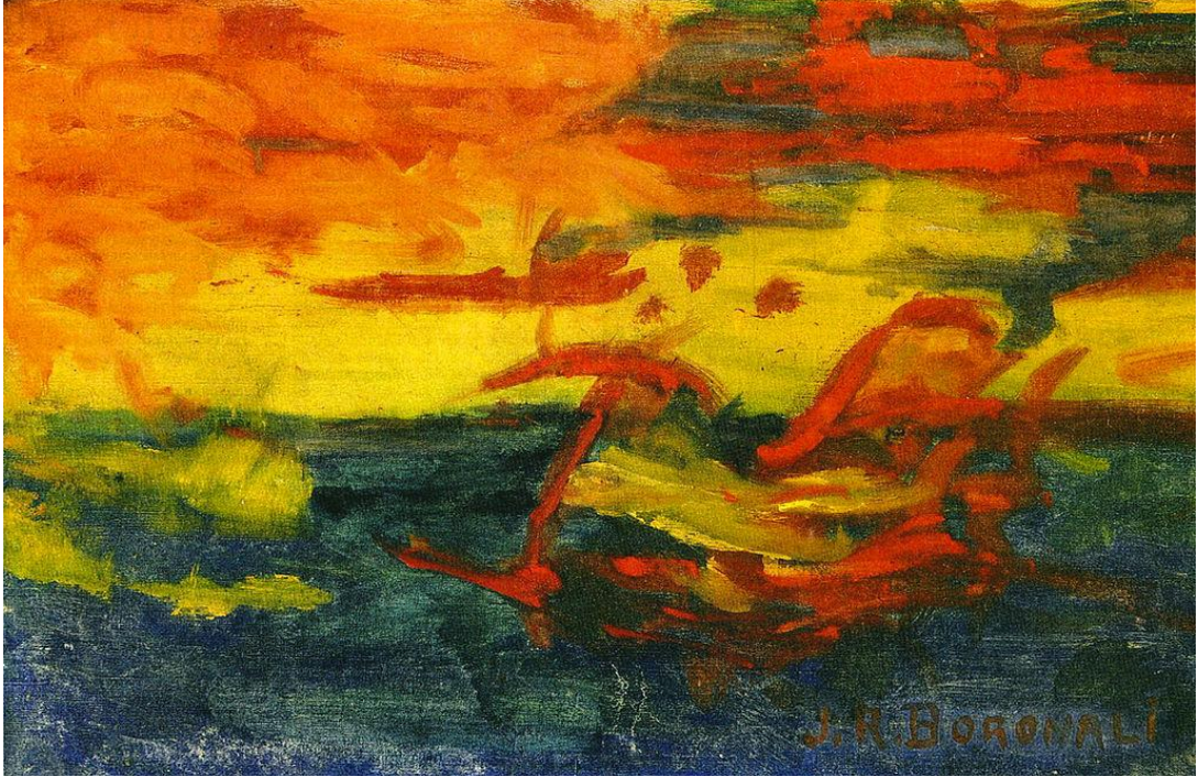
“Ve Adriyatik'te Uyuyan Bir Güneş” Joachim Raphaël Boronali, 1910